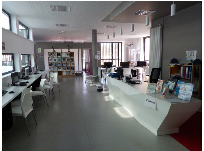
▲ Le CDI