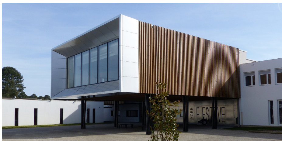
▲ Salle de conférence