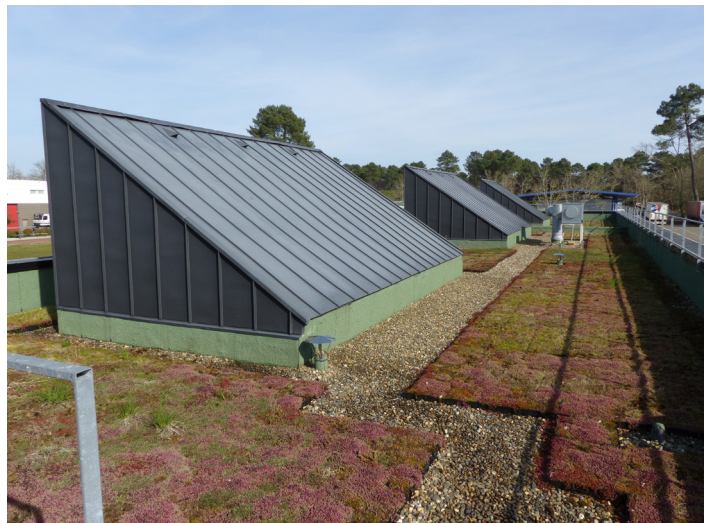
▲ Toit des vestiaires