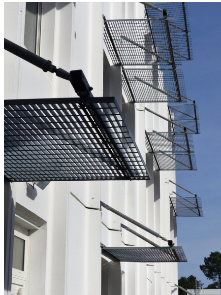
▲ Brises-soleil de l'internat