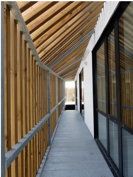
▲ Habillage intérieur en bois